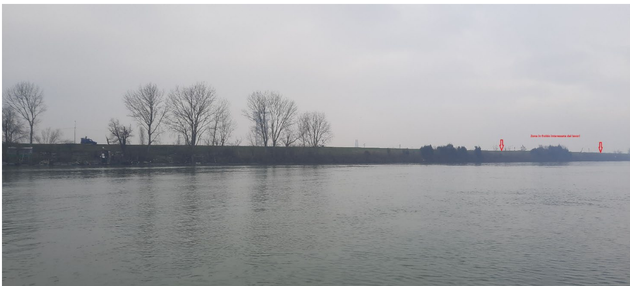
Foto 1 Frodo visto dal fiume con indicata la zona d'intervento